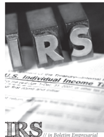
IRS // in Boletim Empresarial

A Direcção-Geral dos Impostos já fixou o calendário de entrega das declarações de IRS de 2011, tendo seguido as datas adoptadas no ano passado.